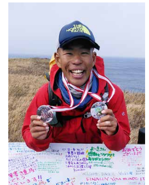
1983年6月5日生まれ / 31歳 A型 / ふたご座 / 180センチ / 74キロ

昨年、新たな挑戦として、南は屋久島、北は利尻島までの「日本百名山ひと筆書き」7800kmの旅を208日と11時間で達成。 そして今年、宗谷岬をスタートし、佐多岬をゴールとする200名山の未踏の100座をひと筆書きで挑戦し、新たなステージを目指す。